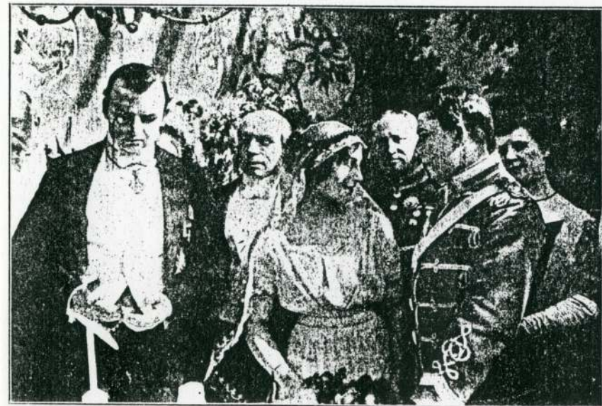
Victoria-Teatret: „Haanden der griber“